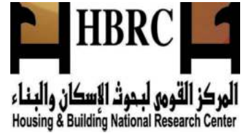
المركز القومي للبحوث